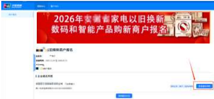
第一步 进入已报名企业，点击“查看报名详情”