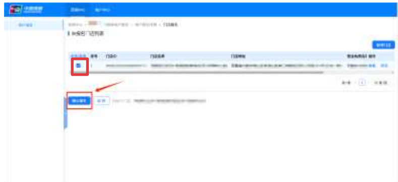
第六步 勾选填好信息的门店，点击提交，完成门店信息填写。