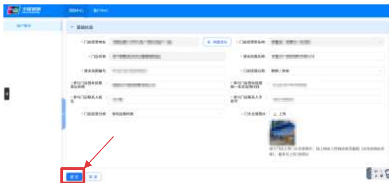
第五步 填好表格内其他门店信息，点击提交。