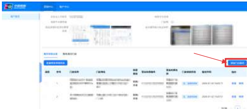
第二步 网页下划到底部，找到添加门店信息