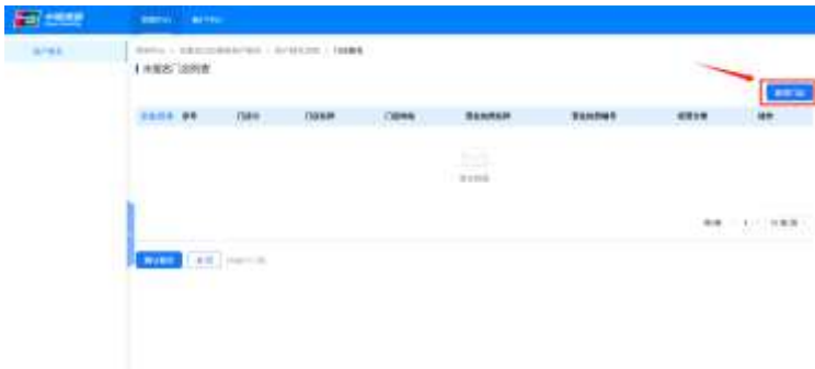
第三步 点击“新增门店”