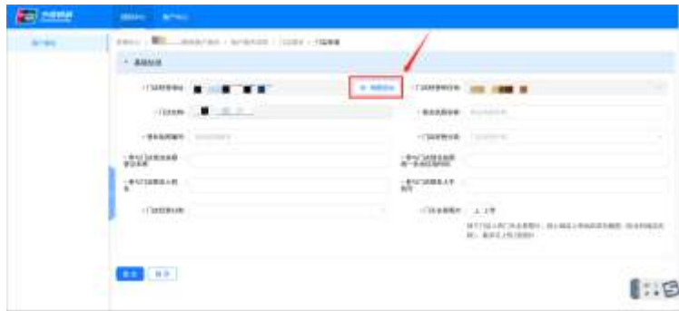
第四步 点击“地图选址”，在百度地图搜索门店地址，选择后自动带出门店经营所在地及门店名称。